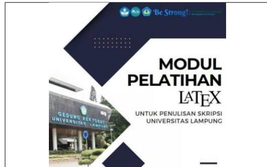
Gambar 3. Modul Pelatihan LaTeX

LaTeX dan mengenal fungsi dari setiap perintah atau sintaks yang disampaikan. Selain itu, modul juga dapat digunakan oleh peserta sebagai bahan untuk latihan di luar pelatihan. Modul pelatihan ini terdiri dari 3 bab, diantaranya adalah Pendahuluan, Dasar-dasar Pembuatan Dokumen, dan Penulisan Skripsi dengan Menggunakan LaTeX.