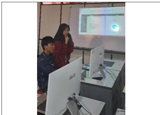
Gambar 5. Pendampingan Pelatihan LaTeX

Peserta antusias untuk mencoba mempraktikkan langsung dengan mengetikkan perintah ataupun isi dari template skripsi. Narasumber dan anggota tim lainnya membantu menjawab pertanyaan dan mengoreksi hasil kerja peserta.