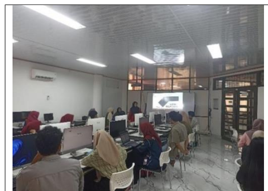
Gambar 4. Penyajian Materi dengan Modul Pelatihan

Pelaksanaan kegiatan pelatihan ini dilakukan di ruang Laboratorium Komputer Jurusan Matematika pada hari Kamis, 24 Oktober 2024. Peserta yang hadir merupakan mahasiswa semester 5 sebanyak 19 orang mahasiswa. Terdapat satu narasumber dari tim pengabdian dengan anggota lainnya membantu peserta untuk menjawab pertanyaan dan praktik langsung dalam penulisan skripsi menggunakan aplikasi LaTeX online Overleaf .