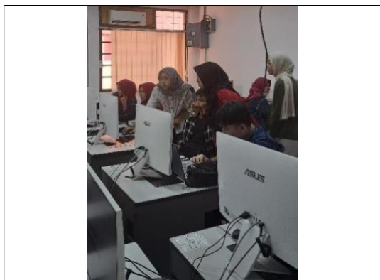
Gambar 6. Narasumber dan Tim Pengabdian Mendampingi Peserta Pelatihan LaTeX

Peserta antusias untuk mencoba mempraktikkan langsung dengan mengetikkan perintah ataupun isi dari template skripsi. Narasumber dan anggota tim lainnya membantu menjawab pertanyaan dan mengoreksi hasil kerja peserta.