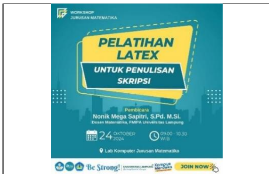
Gambar 1. Flyer Pelatihan LaTeX

Pelaksanaan kegiatan pengabdian kepada masyarakat ini dimulai dari tahap persiapan pelatihan, yaitu melakukan kontak dengan Kajur Matematika untuk meminta izin pelaksanaan pelatihan. Koordinasi ini juga dilakukan untuk memastikan tanggal pasti pelaksanaan pelatihan, persiapan ruangan Laboratorium Komputer, alat-alat pendukung kegiatan pelatihan, serta penentuan mahasiswa semester 5 sebagai peserta pelatihan. Selanjutnya dilakukan sosialisasi pelatihan kepada mahasiswa semester 5 Program Studi Sarjana Matematika. Sosialisasi ini dilakukan dengan mengirimkan flyer pelatihan LaTeX berikut ini.